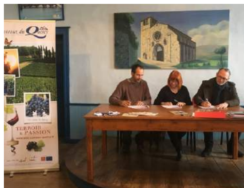
Signature de la convention de partenariat pour la candidature au label "Vignobles & Découvertes" en décembre 2018 © ADT82.

Cet été, chaque dimanche pendant le marché, l'Office de Tourisme en Quercy Blanc et le syndicat des vins des Coteaux du Quercy ont ouvert à