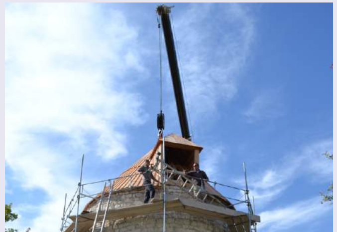
Dépose du toit du moulin de Ramps