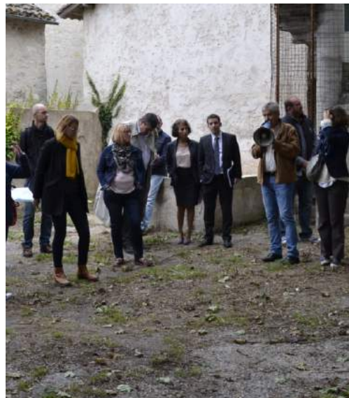
Visite de l'îlot Sainte-Marie avec les urbanistes en octobre 2017.

Un petit rappel : suite à l'acquisition en 2017 de l'îlot Sainte-Marie, le conseil municipal a décidé de prendre rang dans le dispositif de la Région Occitanie portant sur le développement et la valorisation des bourgs-centres (voir journal communal 2017 consultable sur le site de la mairie).