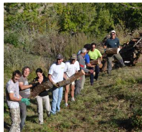
Chaîne humaine à la Truque de Maurélis lors du déboisement.