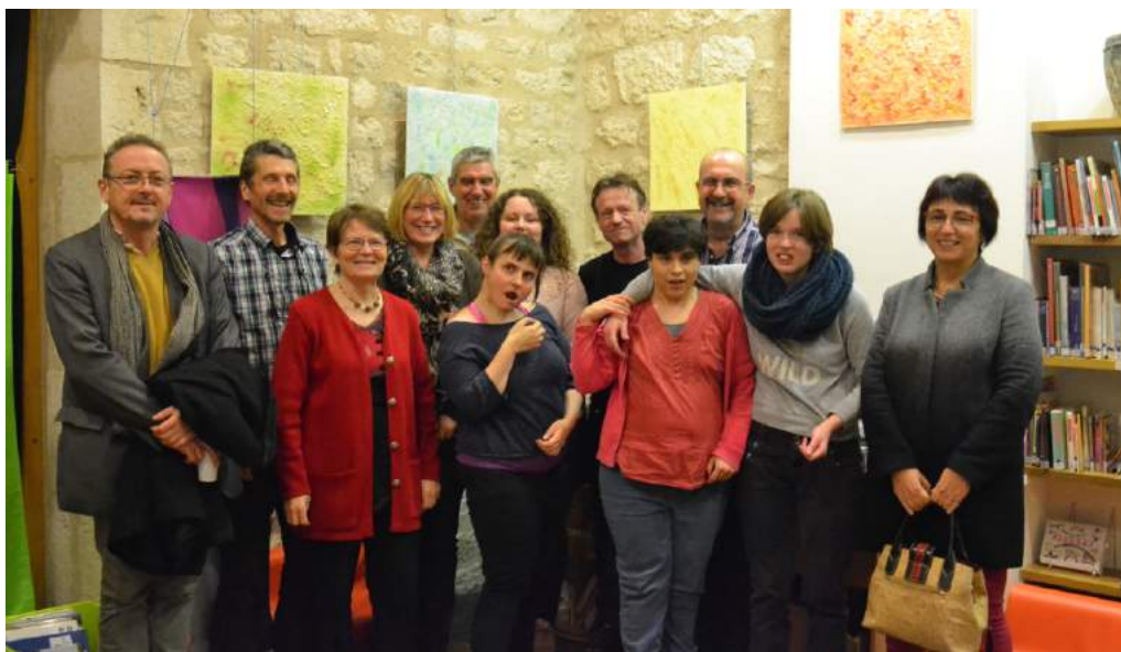
Exposition en décembre 2018 des créations des résidents du Chemin d'Éole.

De plus, en partenariat avec la Bibliothèque Départementale du Lot et la CAF, elle participe à l'opération « Premières Pages » financée par la CCQB. Dans ce cadre là, elle intervient auprès des écoles maternelles et des crèches de Castelnau-Montratier, Flaugnac et Lhospitalet et se déplace même à la bibliothèque de Lhospitalet.