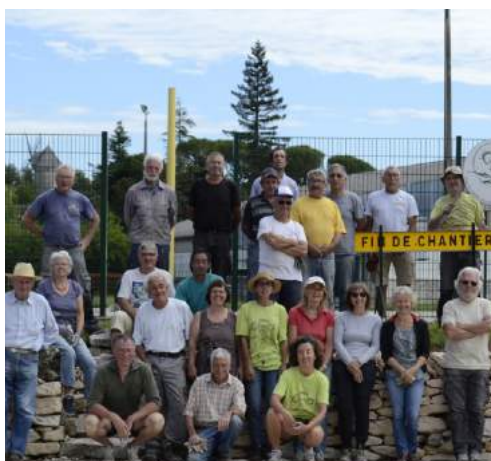
L'équipe de Patrimoine de nos enfants à la fin du chantier du parking.

Dans le même esprit, cette association est en train de dégager et de valoriser la Truque de Maurélis. Cette motte castrale du IX e siècle, ancêtre des châteaux forts, est un patrimoine unique en France qui a résisté à l'usure du temps. Elle mérite des travaux de conservation.