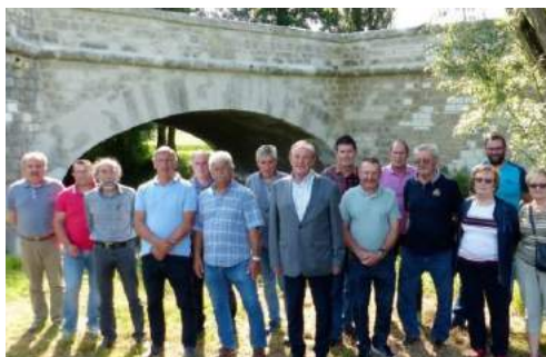
La CCQB, les élus lors de la visite de fin de chantier de la restauration.

La Communauté de Communes du Quercy Blanc, responsable de cet ouvrage d'art et des ouvrages d'art en général, a donc diligenté des travaux de consolidation et de restauration de sa structure.